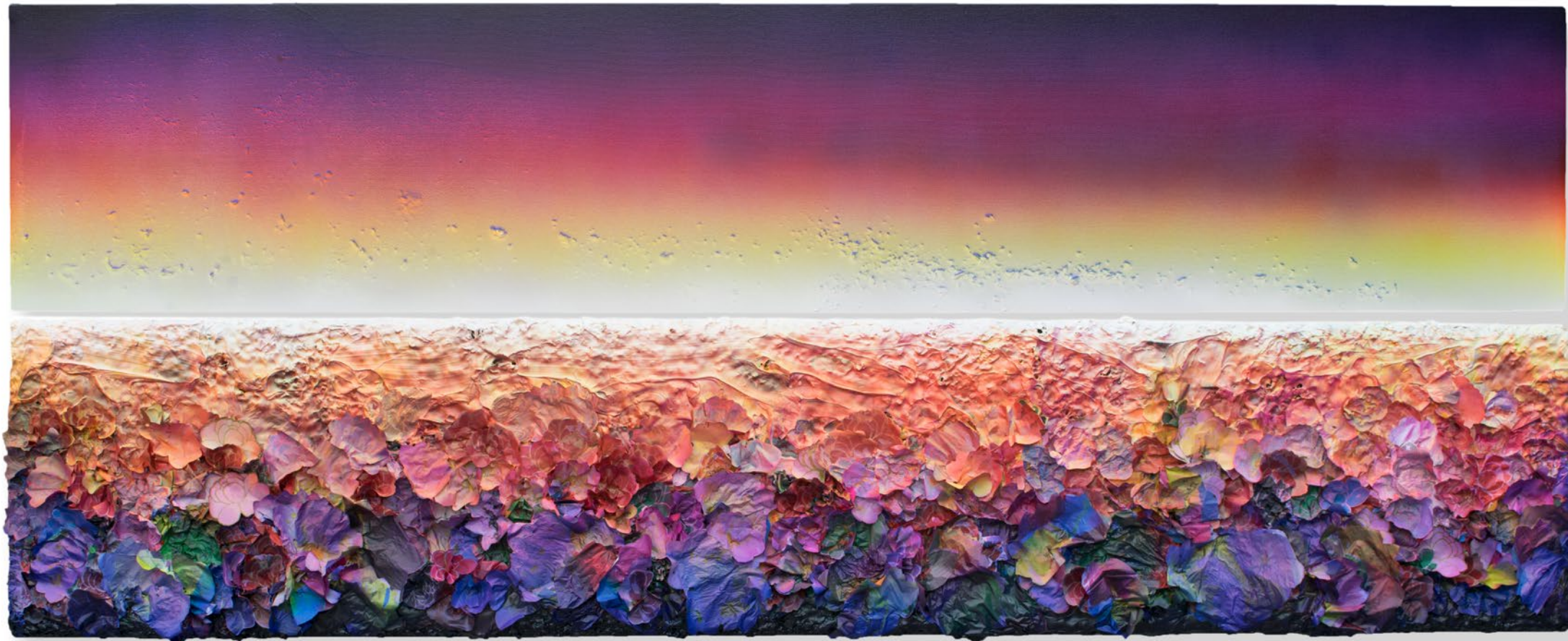
Landscape 18-031P1/026P2 - 120 X 300 cm, rijstpapier, acrylverf op canvas