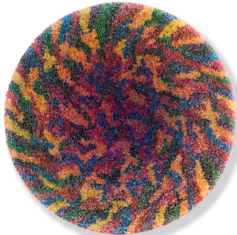
Flowerbed Colour Change - 18-VI-049 - Ø 190 cm, rijstpapier, acrylverf op canvas