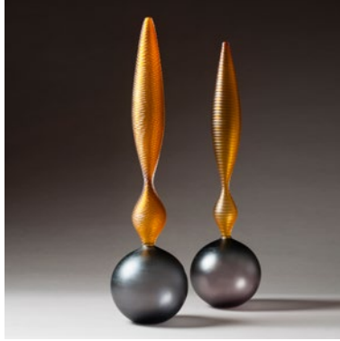
Baldwin / Guggisberg