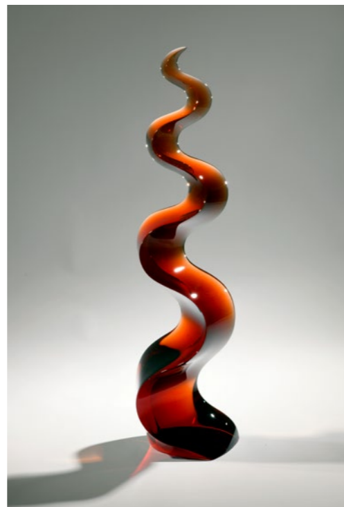
Energizing Red Vibration, 2020 | 71x20x14cm