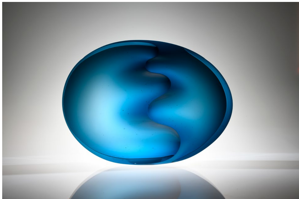
Optical Wave I, 2020 | 45x63x9.6cm