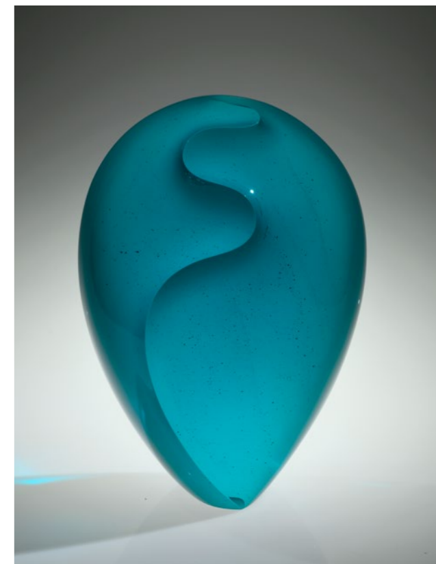
Blue Brain Wave, 2020 | 41x29x18cm