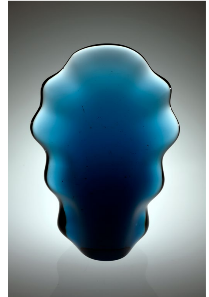
Nightblue Vibration, 2020 | 48x34x13 cm