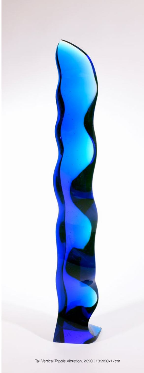
Tall Vertical Tripple Vibration, 2020 | 139x20x17cm