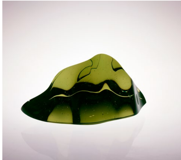
Small Vibration I, 2020 | 13x29x15cm