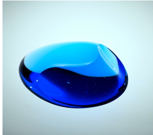
Small Wave I, 2020 | 8x29x18cm