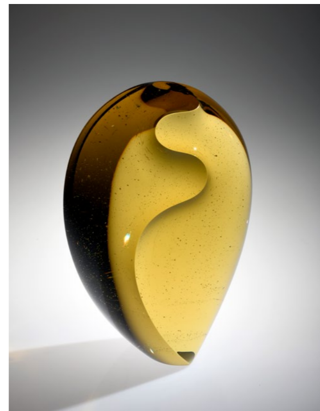
Enlightened Brain Wave, 2020 | 41x29x18cm