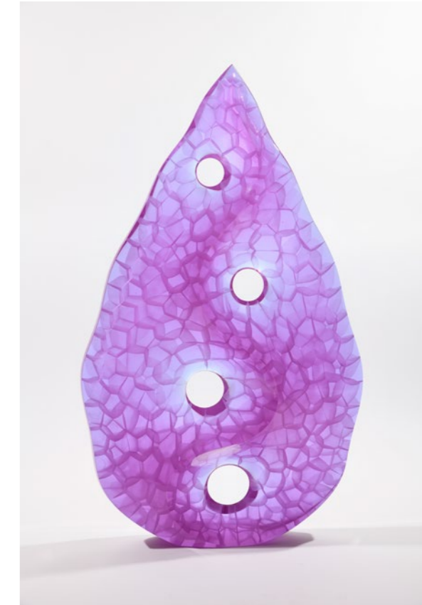
Natural Vibration, 2020 | 100x60x10cm