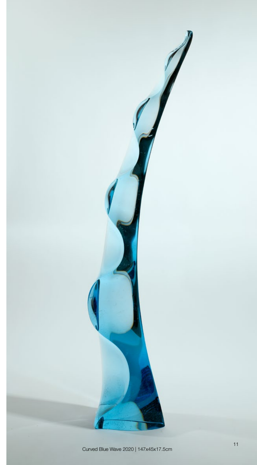
Curved Blue Wave 2020 | 147x45x17.5cm