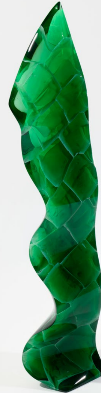
Natural Green Wave, 2019 | 118x19x35cm