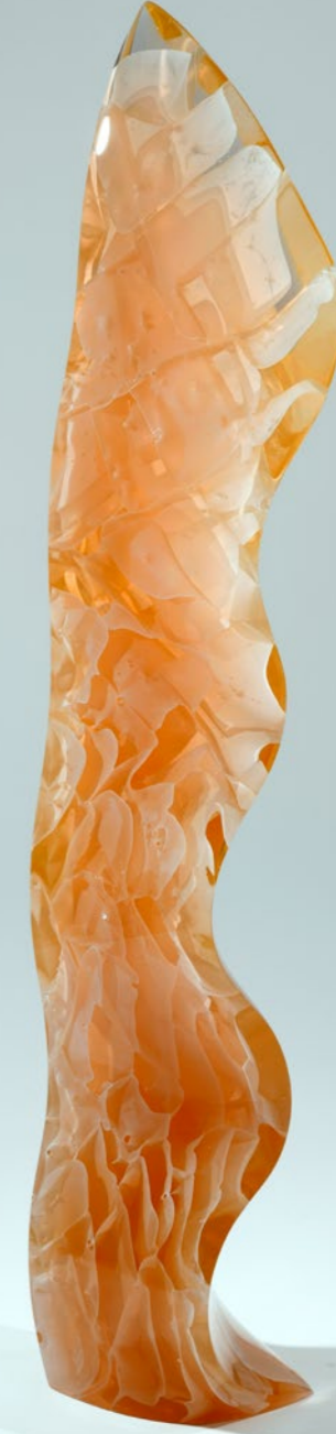
Honey Wave, 2020 | 118x19x35cm