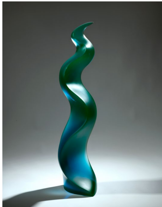
Velvet U-Blue Slow Wave, 2020 | 86x21x17cm