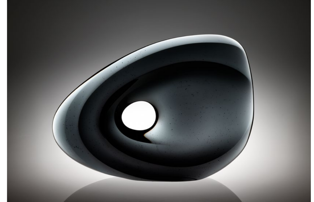
Propelling Space I, 2019 | 47x67x10cm