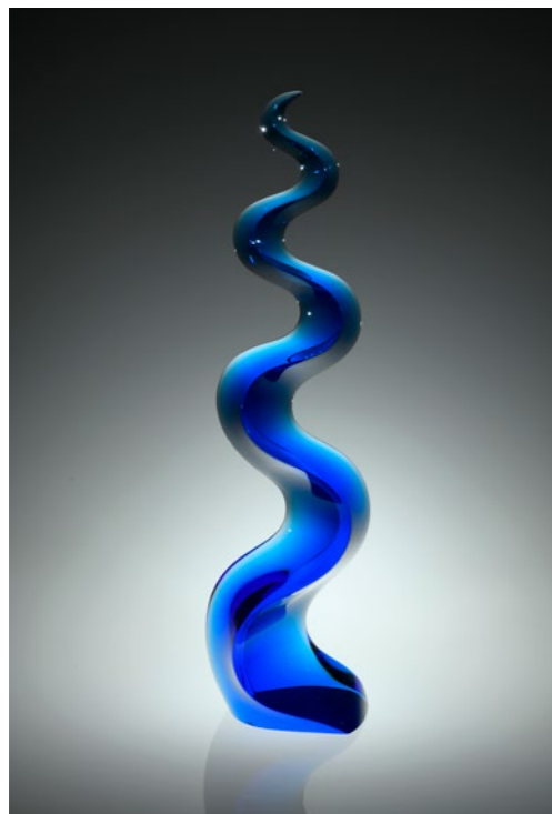
Energizing Blue Vibration, 2020 | 71x20x14cm