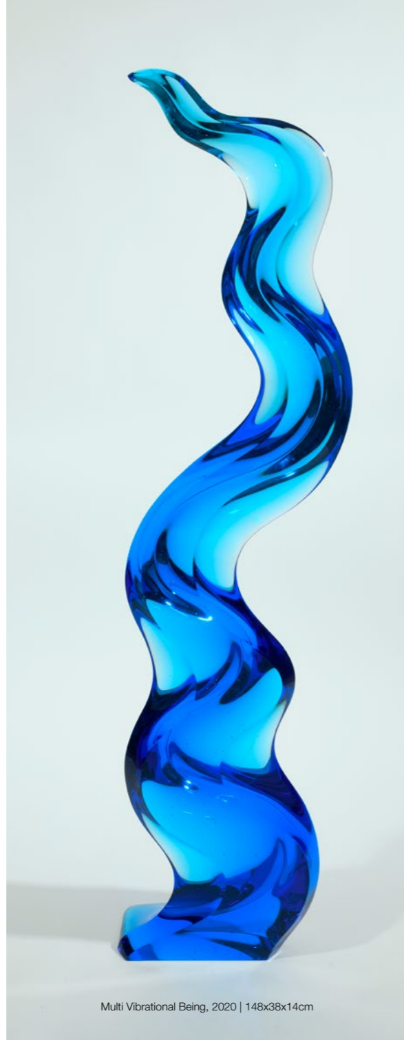
Multi Vibrational Being, 2020 | 148x38x14cm