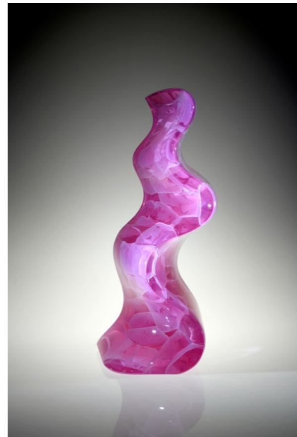
Amethyst Short Wave, 2020 | 49x23x19cm