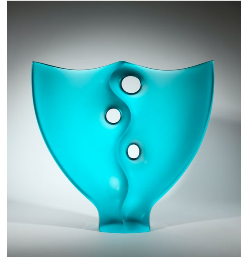
A-Vibrations, 2020 | 80x83x13cm