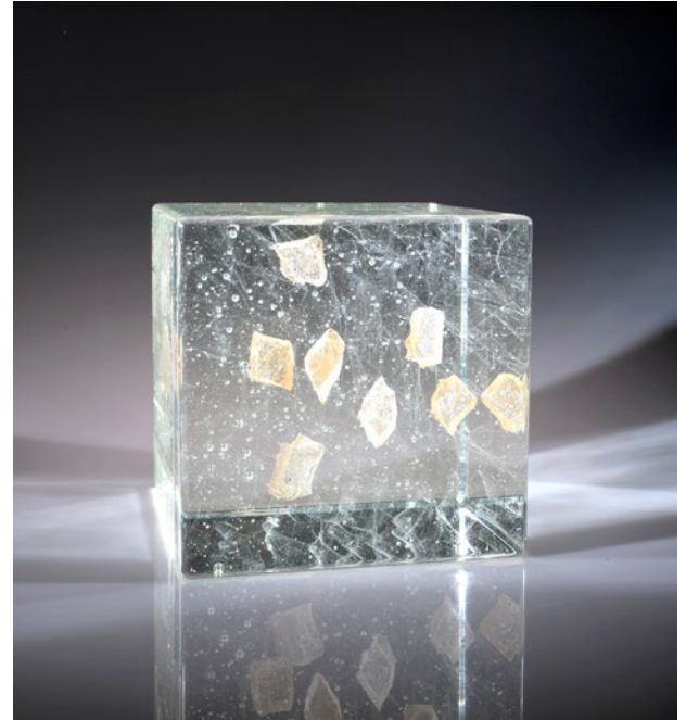
7 Souls, 2020 | 20x20x20cm