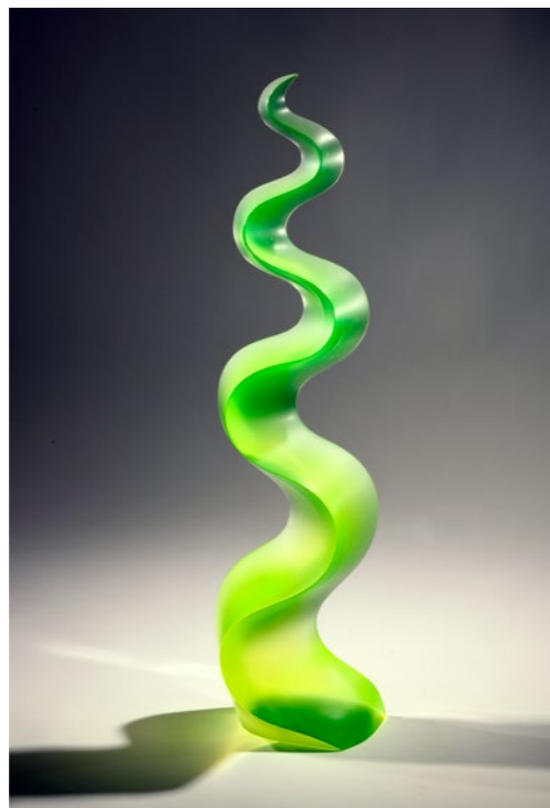
Energizing Neon Vibration, 2020 | 71x20x14cm