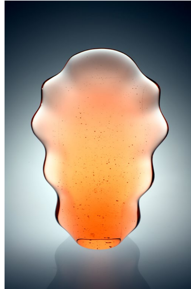
Rosalin Vibration, 2020 | 48x34x13 cm