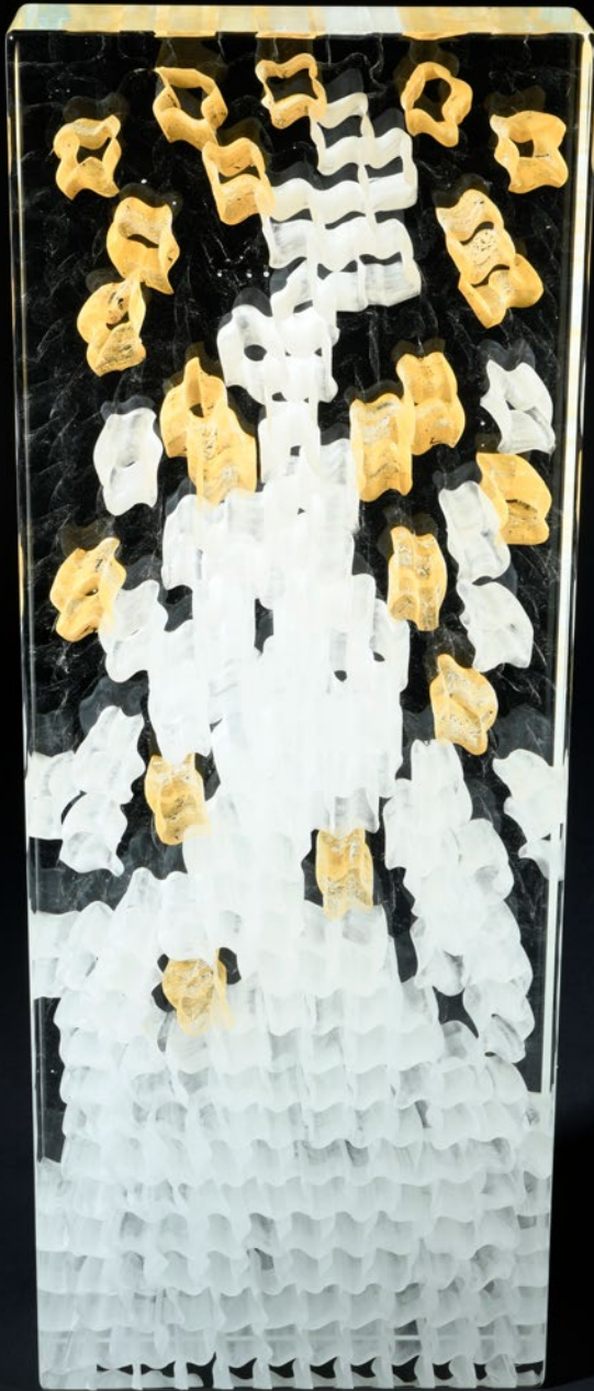
Liberation, 2020 | 80x30x11cm