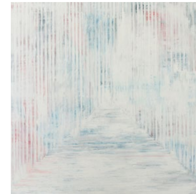
Ineke van Koningsbruggen