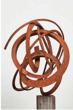
Pieter Obels Bedrieglijk Eenvoudig, 2020 80x85x75cm