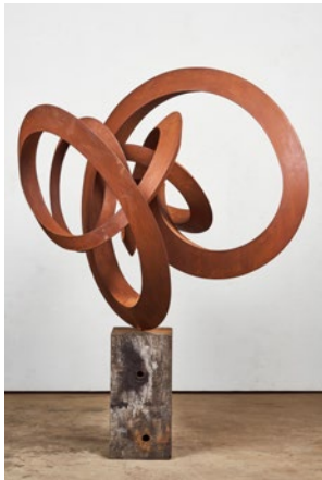
Pieter Obels Imagined Worlds, 2020 135x135x125cm