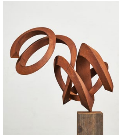
Pieter Obels Onverwachte Intimiteit, 2020 68x90x63cm

Wij hebben de expositie van Pieter Obels in april moeten annuleren vanwege het coronavirus. Tijdens de komende groepsexpositie zal een groot gedeelte van de galerie ingericht zijn met de nieuwe sculpturen van Pieter.