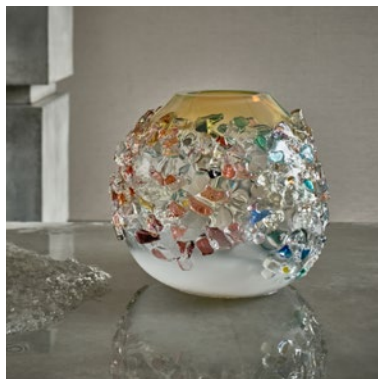
Sakura TRP19021, 26x29x29cm