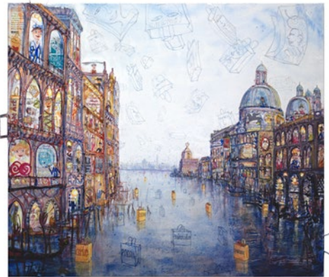
Venezia, Urban Bag Art, 2019 140x160cm