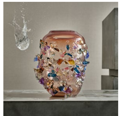
Sakura TRP19012, 45x39x35cm