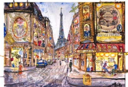
Paris Cafe, 2019 50x70cm