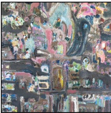
Grow, 2020 126x126cm