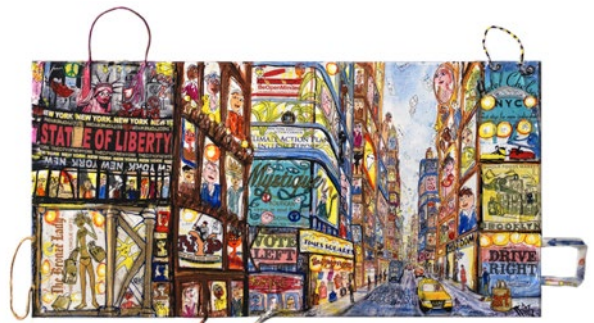
NY Broadway, 2020 50x100cm

Thitz is een meester in het schilderen van een levendig stadslandschap. New York, Tokyo, Barcelona, hij schilderde alle grote metropolen in acryl en inkt over 'papieren tassen' op canvas, de handvatten steken aan de rand van het beeld uit als identificatietegels. Zijn werken worden wereldwijd geëxposeerd.