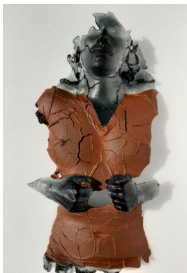
Emptiness, 2020 75x40x12cm

'Zolang ik me herinneren kan, ben ik altijd al gefascineerd geweest door de arrogante overlevingskracht van objecten, die tijd, geschiedenis en menselijke leven in zich dragen. In mijn werk verander ik levende mensen in 'objecten', in toekomstige documenten van hun huidige leven.'