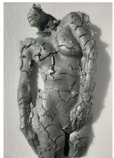
Winter, 2020 94x52x12cm