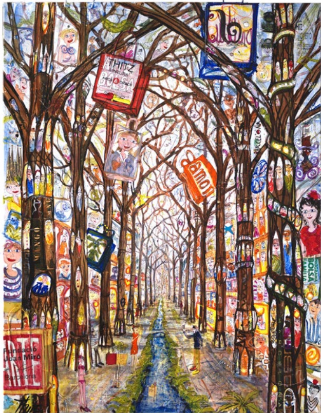
Barcelona Utopia Sagrada, 2019 180x140cm