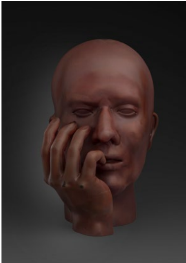
Thinker, 2020 hoogte 28cm